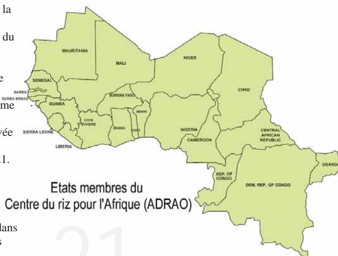
Etats membres du Centre du riz pour l'Afrique (ADRAO)

Pour la première fois , des représentants de plusieurs groupes d'acteurs ont été invités, en qualité d'observateurs, au réunions tenues dans le cadre de la session du Conseil des ministres : organisations paysannes, CTA, Alliance du GCRAI, UEMOA, CMA/AOC.