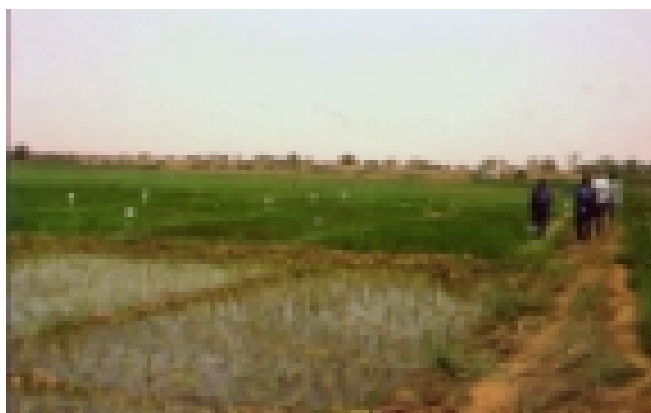
Comparaison de la pratique paysanne (premier plan) avec des essais de démonstration de la gestion améliorée : les paysans étaient clairement en dessous des rendements potentiels