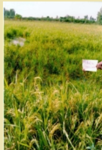
Il est fréquent de trouver des poches improductives à travers les champs paysans dans la vallée du Sourou. Elles peuvent être associées à des dépôts de calcaire et/ou à des problèmes de drainage. La forte productivité à proximité des diguettes est l'indication d'un éventuel problème d'éléments nutritifs : les plantes proches des diguettes souffrent moins de la compétition pour les éléments nutritifs

Des essais d'omission d'éléments nutritifs vont commencer en 2000, pendant au moins deux saisons, pour examiner particulièrement le rôle des engrais de phosphate et de zinc, mais aussi le traitement au nématicide. Le suivi des pratiques paysannes va se poursuivre et la situation des vers de terres sera suivie et évaluée. « Peut-être que l'année prochaine, nous commencerons le test des bilans hydriques et de sel, ainsi que l'installation de piézomètres pour suivre les changements dans la profondeur de l'eau souterraine », a conclu Barro.