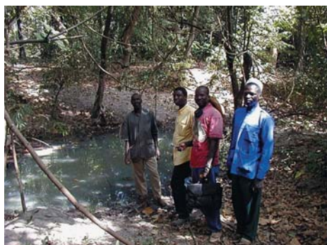
Novembre 2001 : Membres de l'Unité nationale de coordination du CBF du Burkina Faso dans le bas-fond de Bletou

Juillet 2001 : L'ancien Coordinateur régional du CBF visite une station radio locale au Bénin : la radio locale est un bon moyen pour communiquer les messages de développement aux communautés rurales. Cette station radio est proche des sites clés du CBF, Gankpetin et Gomè